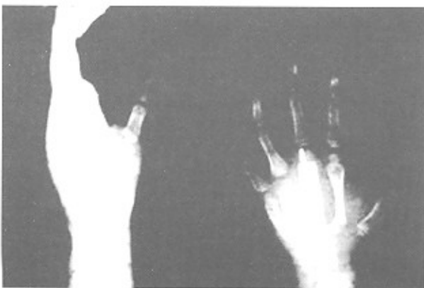
شکل ۱-ب- در عمل جراحی تومور کاملا برداشته شد و سیمان به عنوان spacer گذاشته شد.

شامل می‌شود (۲). درگیری تمامی استخوان‌های بدن در استئوبلاستوما امکان‌پذیر است (۳-۵) ولی این تومور تعابیل خاصی برای درگیری ستون فقرات دارد. درگیری استخوانهای توبرلر کوتاه دست و پا، در ۱۰٪ موارد گزارش شده است. استئوبلاستوما منفرد دست بسیار نادر است (۶-۹، ۲) بطوریکه تاکنون تنها در ده مقاله انگلیسی زبان چنین درگیری شرح داده شده است (۸-۱۱). در مقاله حاضر ما ۵ مورد استئوبلاستوما دست را که در بخش ارتوپدی بیمارستان امام خمینی (ره) از سال ۱۳۷۱ تاکنون تشخیص داده شده و تحت درمان قرار گرفته‌اند را معرفی کرده‌ایم.