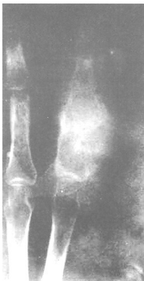
شکل ۲- ضایعه لیتیک در فالانکس پروگزیمال. تشخیص اولیه استئوسارکوم بوده است.