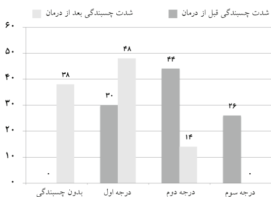
نمودار ۲: فراوانی شدت چسبندگی قبل و پس از درمان

یا فرد مراقبت‌کننده بیمار داده شد. علاوه بر آن جزوه‌ای به صورت مکتوب در اختیار وی قرار گرفت. هشت روز بعد از شروع درمان بار دیگر بیمار تحت معاینه قرار گرفته و مقدار پاسخ‌دهی به درمان به صورت زیر تقسیم‌بندی شد: