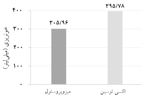
نمودار-۲: ارزیابی حجم خونریزی در دو گروه تحت مطالعه