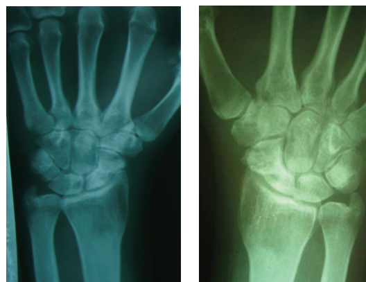
شکل- ۱: رادیوگرافی رخ مچ دست قبل از عمل (سمت چپ) و در بررسی نهایی پس از عمل (سمت راست) جهت بررسی وقوع یونیون